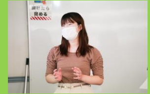
人吉市・球磨村グループ